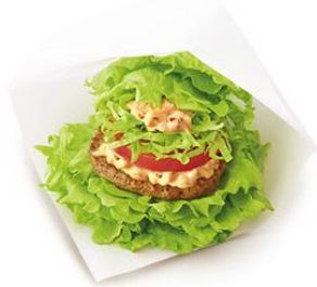
「モスの菜摘 なつみ 」シリーズ バンズの代わりに レタスで挟んだ ハンバーガー