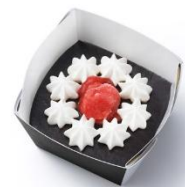
「アイドルチェ カップ ショコラ風ムースケーキ」 卵・乳・小麦と動物性原料を 二次原料までに使用せず、 作ったデザート