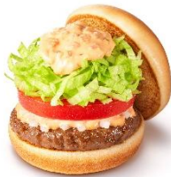
「ソイパティ」シリーズ 大豆由来の 植物性たんぱくを 主原料としたパティ