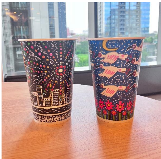
「MOS ごと美術館イラストカップ」 (左:『Fire works』、右:『秋桜と朱鷺』)

モスグループでは、障がいのある方の社会参加支援とともに、障がいのある方のアート作品をモスバーガーの店舗に展示し、気軽に親しんでいただける機会を創出する取り組みを「MOSごと美術館」と呼んでいます。2016年から新潟県の「まちごと美術館cotocoto」事業に賛同してスタートし、その後2019年には東京都内で開催、2021年にはアート作品を店舗の内装デザインに使用した「モスバーガー 原宿表参道店」(東京都渋谷区)がオープンするなど、「MOSごと美術館」としてのアート作品の利用を広げてきました。