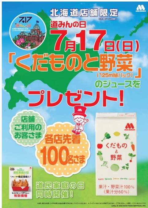
【『道みんの日』告知ツールイメージ】

※2『道民家庭の日』は、平成12年7月10日に開催した「青少年の非行防止道民総ぐるみ大会」において、「家庭が果たす役割の重要性を再認識するため、家族が団らんでできる機会を持つ日として毎月第3日曜日を『道民家庭の日』」とすることを提唱し、北海道、北海道教育委員会、北海道警察本部とともに普及促進に取り組んでいます。（北海道青少年育成協会ホームページより）