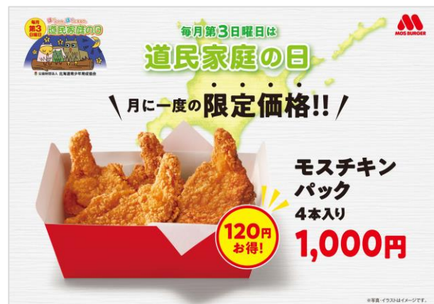
【『道民家庭の日』告知ツールイメージ】