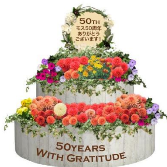
<店舗前フォトスポット>