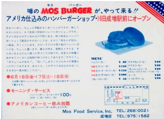
<1号店オープンのチラシ>

モスバーガー1号店は、現在の「モスバーガー成増店」と同じ場所に八百屋の倉庫を借り受けて、わずか2.8坪の広さで 1972年 6月にオープンしました。当時お客さまの中心だった学生の方々にもチラシ配りをご協力いただくなど、創業当時から地元の方々のあたたかいご厚意に支えられてきました。看板商品「モスバーガー」は創業期から発売しているロングセラーです。