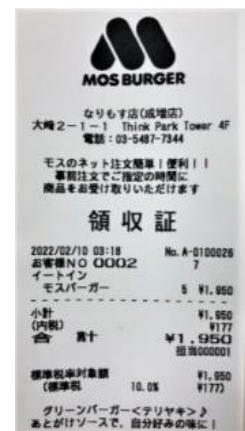
<なりもす店レシート>