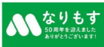
<隣接ビル屋上看板>