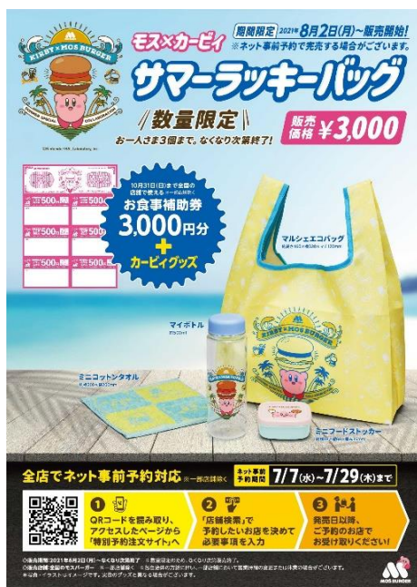
【ポスターイメージ】

*「モス×カービィ サマーラッキーバッグ」特設ページの公開は7月7日（水）からになります。