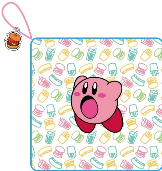
【ミニガーゼタオル】