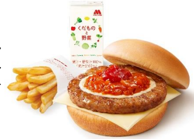
【ワイワイモスバーガーセット<スライスチーズ入り>】

※4セットドリンク対象のコールドドリンクや、プラス(19円+税)でモスシェイクSサイズもお選びいただけます。