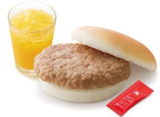
【ポークサンド<米粉>ドリンクとおもちゃ付きセット】

株式会社モスフードサービスでは、「人間貢献・社会貢献」の経営理念のもと、「おいしさ、安全、健康」という考え方を大切にされた商品を「真心と笑顔のサービス」とともに提供することに一貫して取り組んでいます。高い顧客満足を得るため、今後も積極的な販促ツールの開発を進め、「食を通じて人を幸せにすること」を実現してまいります。