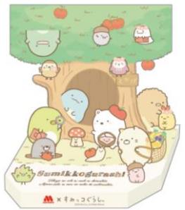
※仕上がりイメージ