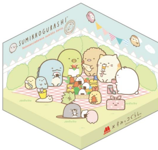
【ペーパークラフト】