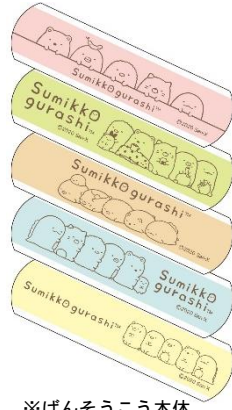
※ばんそうこう本体