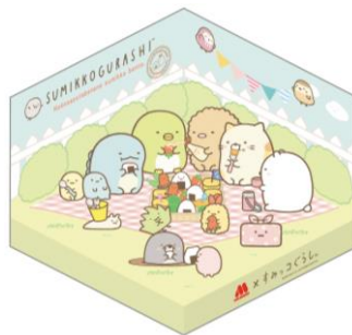
※仕上がりイメージ