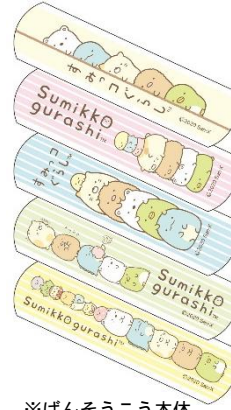
※ばんそうこう本体