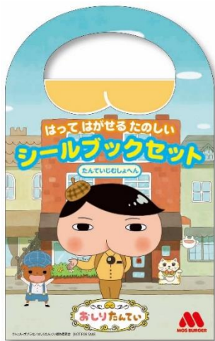
【シールブックセット（たんでいじむしょ編）】