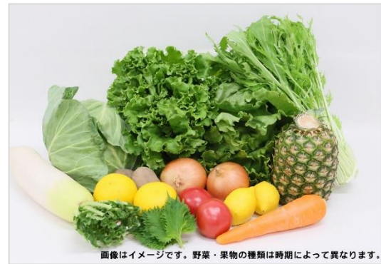
画像はイメージです。野菜・果物の種類は時期によって異なります。