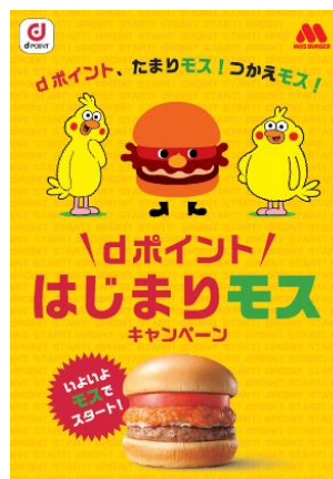
【A4 キャンペーンツール】