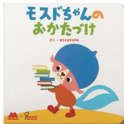
【モスバーガー 絵本 『mosdochannyaのおかたづけ』】

今回の「MOSDO！」コラボ絵本は、「食べるって楽しい！」を共通テーマに開発をしました。人気絵本作家の accototo（アッコトト）さんに、お子さまが食べることの楽しさや喜びを感じられるようなオリジナルの絵本を書き下ろしていただきました。モルモット・スカンク・どんぐりをモチーフとした主人公の“mosdochannya”が両絵本に登場し“食べることの楽しさ”を感じ、“知的探求心”を育むことに役立てていただけるような内容です。