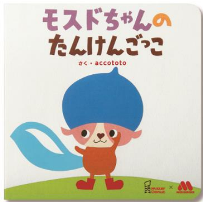
【ミスタードーナツ 絵本 『mosdochannyaのたんけんごっこ』】

ミスタードーナツとモスバーガーは、合計約2,300店舗のスケールメリットを生かし、それぞれの得意分野や経営資源を有効活用することで中長期的なシナジーを生み出し、両社の企業価値向上を目指して、2008年2月に資本業務提携を行いました。資本業務提携以降、ミスタードーナツとモスバーガーでは「MOSDO！」を共通のコラボレーションマークとし、さまざまな側面において両社の強みを生かした施策を展開しています。これまでも、共通テーマのもとでの新商品開発や、「MOSDO！」を代表とする共同店舗の出店、CMキャラクターのトレードなど、「MOSDO！」ブランドとして共同プロモーションを行ってまいりました。