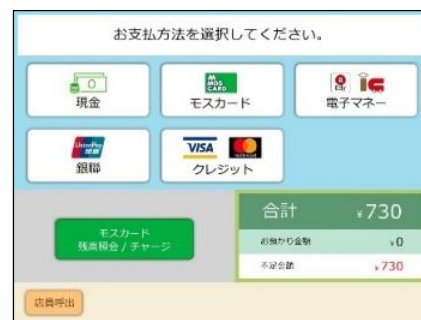
セミセルフレジ 支払い方法選択画面