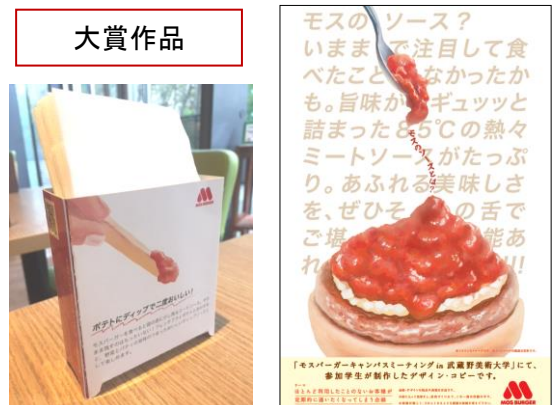
実際に店舗で使用されるナプキンホルダー（左） 都内3店舗で掲出される垂れ幕（右）