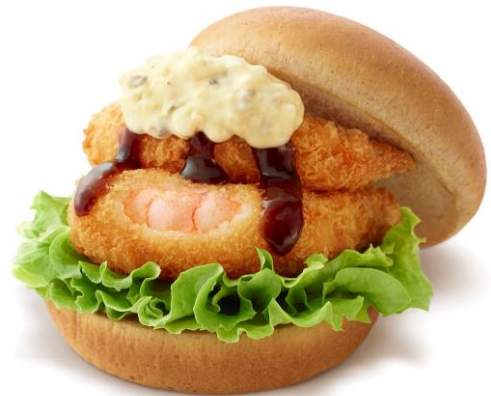
【モスバーガー稲沢アクロスプラザ店からの原案】