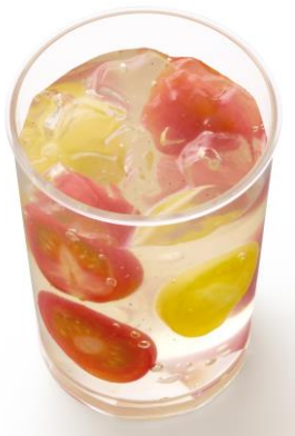
「ベジジュエル ミニトマトのジュレ仕立て」

※今回の発売に伴い、「苺ムースケーキ」「紫芋のモンブラン」「コーヒーゼリーケーキ 香るビター」は販売終了となります。