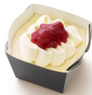
「ふわしとチーズケーキ」