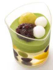
「抹茶と梅の涼味二重 りょうみふたえ 」