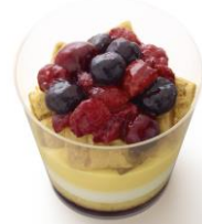
「さくさくパイのベリーケーキ」