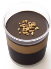
「クーベルチュールカフェゼリー」