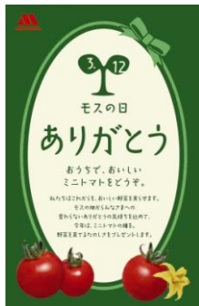
ミニトマトの種（袋）