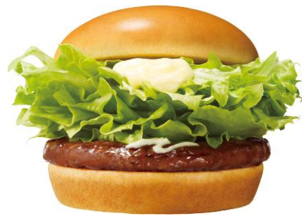
「ドーナツバーガー テリ（わさびソース）」