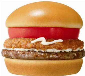
「ドーナツバーガー モス（わさびソース）」

今回の商品開発の共通テーマは、提携発表後からご要望が多かった“ドーナツバーガー”です。モスバーガーでは中央に穴の開いた「ドーナツ型パティ」を新たに使用し、穴の部分には、マヨネーズ、西洋わさび、大根おろしなどを使用したオリジナルのわさびマヨソースを入れました。食べている途中で味の変化が楽しめる、遊び心あふれる商品です。