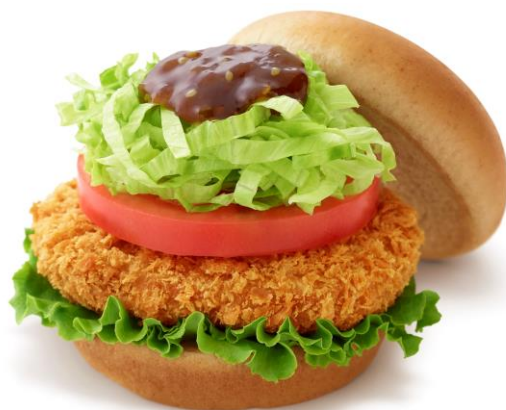
【北見しょうゆタレとんかつバーガー 北海道産ポーク使用】