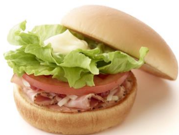
【モスのモーニングバーガー B. L. T.】

当チェーンでは1990年代より、朝限定メニューの販売を店舗限定で試験的に行ってきました。2009年10月には、ハンバーガー類にドリンクをセットにしたお得なサービスを、「モーニングサービス」として初めて全店で販売開始し、2013年2月からは大幅に刷新した朝食専用メニューを導入しました。また、2014年4月に、全国のモスバーガー店舗（一部店舗除く）で朝7時オープンを実施しています。今回はお客さまの朝食へのニーズにお応えし、朝食時間帯のさらなる強化のため、朝食専用メニューのリニューアルを実施します。