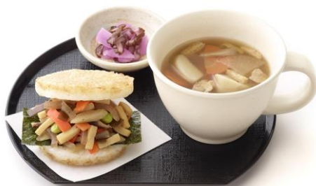
【モスの朝ライスバーガー あさごぜん 朝御膳 「彩り野菜のきんぴら 国産野菜使用」】