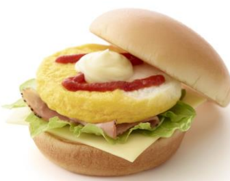
【モスのモーニングバーガー ベーコンエッグチーズ】