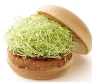
【モスのモーニングバーガー ハムカツ】