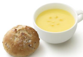
【ライ麦パンとスープのセット】

新商品として、『モスのモーニングバーガー』3種と、『モスの朝ライスバーガー あさごぜん 朝御膳「彩り野菜のきんぴら 国産野菜使用」』（470円）、『ライ麦パンとスープのセット』（360円）の5商品を投入します。