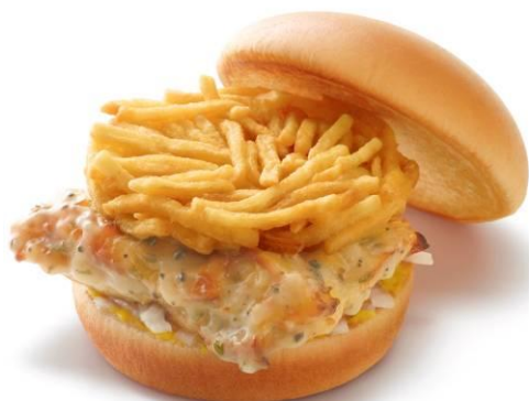
「塩バターチキンバーガー（ペッパー風味）」

今回、期間限定発売する新商品「塩バターチキンバーガー（ペッパー風味）」（360 円）は、日本はもとより特にアジアで人気の高いチキンを、日本発のチェーンらしく丁寧に直火焼きにしたハンバーガーです。香ばしく焼き上げたチキンにはカリッと揚げた専用ポテトフライをあわせました。ソースは、日本向けには揚げ胡椒の香りを効かせた塩バターソースを使用し、海外店舗向けには、アジアで好まれるオレンジの風味を利かせてアレンジしたソースを使用します。